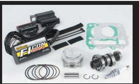
ハイパーチューニングセット