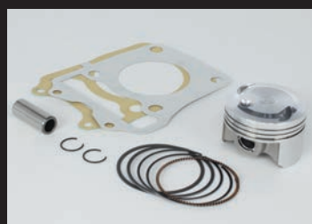
ハイコンピストンキット