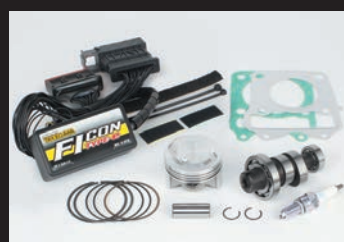
ハイパーチューニングキット