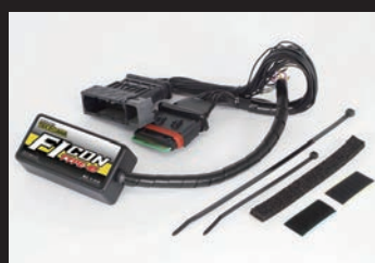
FIコン TYPE-e(インジェクションコントローラー)