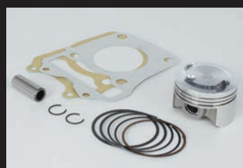
ハイコンピストンキット

■ハイパーチューニングセットは、ハイコンピストンキットにスポーツカムシャフト(N-15)、FIコンTYPE-e(インジェクションコントローラー)、スパークプラグが付属。