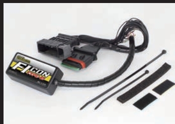
FIコン TYPE-e(インジェクションコントローラー)