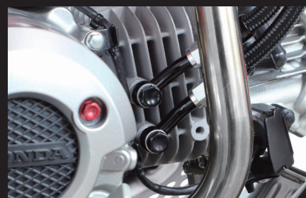
装着写真(オイル取り出し口)