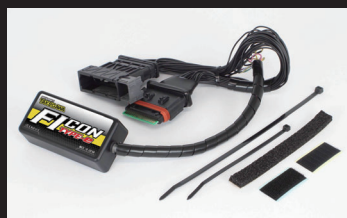
FIコンTYPE-e(インジェクションコントローラー)