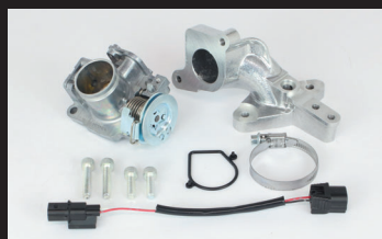
ビッグスロットルボディークット