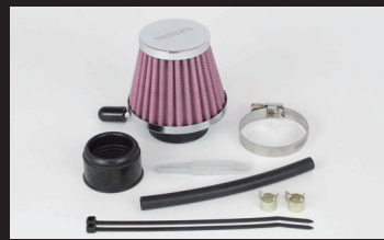
エアフィルターキット