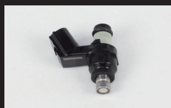
フューエルインジェクター(G-1)