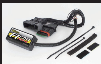
FIコン TYPE-e(インジェクションコントローラー)