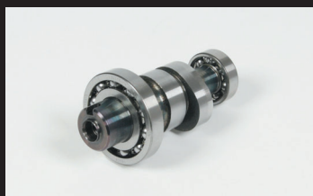
スポーツカムシャフト(N-20)