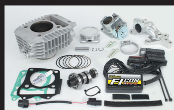
ハイパーSステージボアアップキット181cc