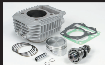
Sステージボアアップキット181cc