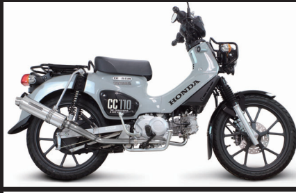
装着写真(クロスカブ110)