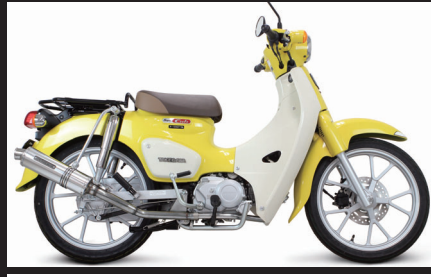
装着写真(スーパーカブ110)