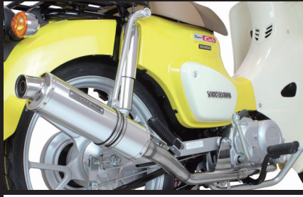
装着写真(スーパーカブ110)