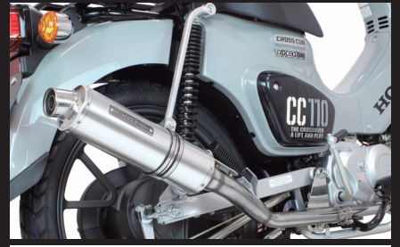
装着写真(クロスカブ110)