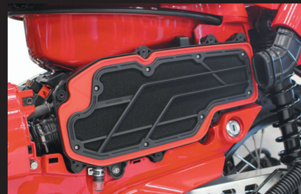
パワーフィルター装着時