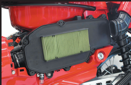
ノーマルエアクリーナーボックス内の純正エレメント