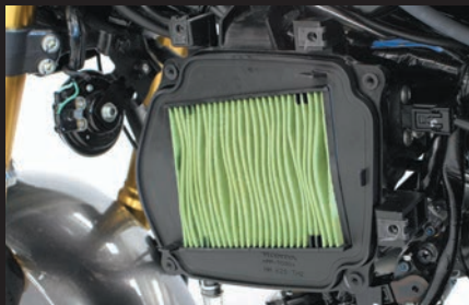
ノーマルエアクリーナーボックス内の純正エレメント