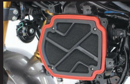
パワーフィルター装着時