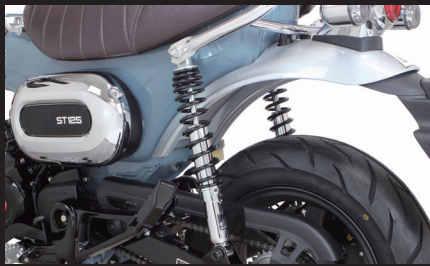
装着写真(ブラック塗装)