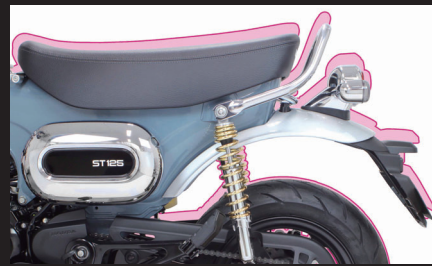
装着写真(シート高:約10mmダウン)