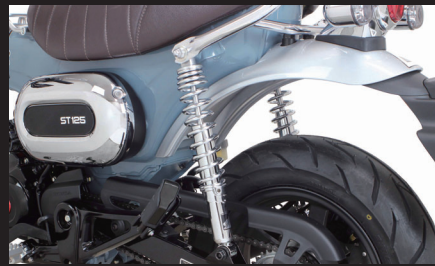
装着写真(クロムメッキ)

※本製品を装着した場合、走行時の車体のバランスをはかる為、同時にフロントフォークを7mmまで突き出す必要があります。 ※フロントフォークの突き出し量は最大7mm以下になります。最大突き出し量以上を行うと、トップブリッジ、ステアリングシステムにフロントフォークが固定できません。ご注意ください。 ※本製品を装着した場合、マフラーと地面の距離が近くなります。カーブや段差等通過時にマフラーが地面と接触する恐れがあるので、注意してください。 ※本製品を装着した場合でも純正サイドスタンドをそのまま使用できます。しかし、純正に比べ、車両の傾きが変わりますので、ご注意ください。