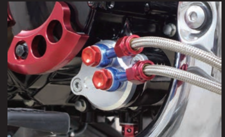
装着写真(オイル取り出し口)