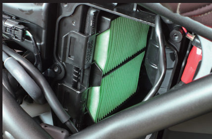
装着写真(ノーマルエアフィルター)