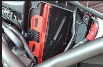
装着写真(SP武川製パワーフィルター)