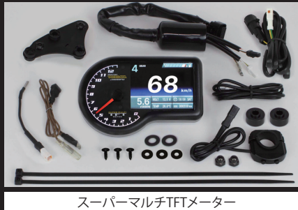
スーパーマルチTFTメーター

バラスト/インバーター(電圧変換装置)からデジタル回路に悪影響を与える高電圧ノイズが出る物があり、製品故障や動作不良の原因になります。 ※ギアポジションの設定に関して ギアポジションの設定にはスピード信号とエンジン回転信号の両方がスーパーマルチ TFT メーターに入力される必要があります。その為、“実走行”による自動読み込み作業が必要になります。市街地では信号機や交通量が多く危険の為、ギアポジションの設定は行わないで下さい。 走行の際は見通しの良い道路を選択し、周囲の道路状況を確認した上で、注意して行って下さい。