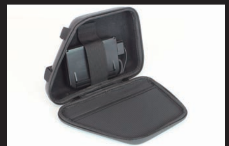
ETC本体をホールドする面ファスナー付きバンド付き。ケースの蓋側にはメッシュポケット付き。