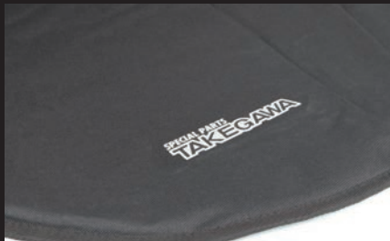
表地: 風防と撥水性に優れたPV防水生地