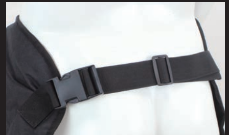
脱着を簡単に行えるワンタッチバックルを採用