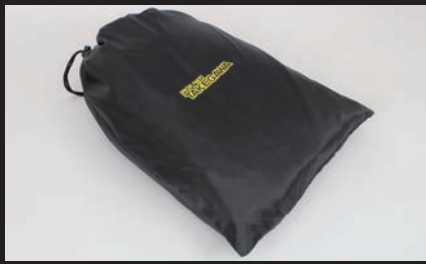
便利な収納バッグ付属