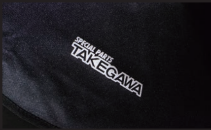
反射プリント採用SP武川ロゴ入りで安全性を高めています