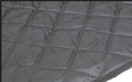
裏地: 防寒と保温効果のある綿充填生地