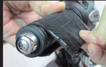
グリップに巻きつけ、面ファスナーで 固定するだけの簡単装着