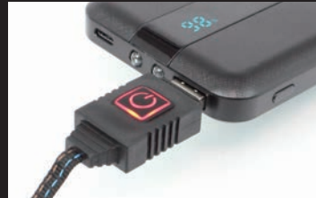
USB TYPE-Aポート給電を採用 USBコネクタとコントローラーを一体化