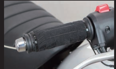
モンキー125 純正アクセサリソケット、 シガーチャージャーを使用して装着