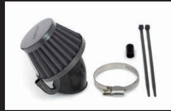
エアフィルターキット(ブラックエレメント)