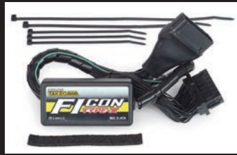
FIコンTYPE-X(インジェクションコントローラー)