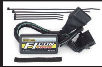
FIコンTYPE-X(インジェクションコントローラー)