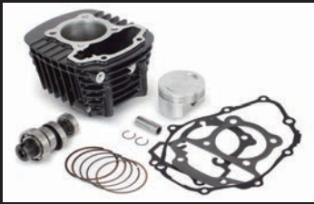
Sステージキット145cc(カムシャフト付属)

※ノーマルエアクリナーへ接続されているコネクティングチューブを取外す必要があります。 ※エアクリナーケースは、エアクリナーガーニッシュを固定する為、取外さず残す必要があります。