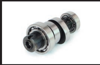
スポーツカムシャフト