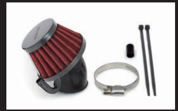
エアフィルターキット(レッドエレメント)