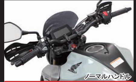
ノーマルハンドル