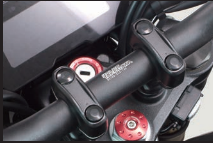
SP武川レーザーマーキングロゴ入り