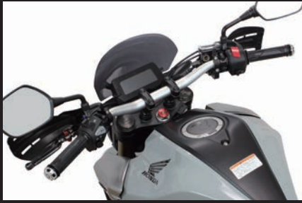
装着写真(シルバー)