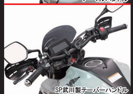
SP武川製テーパーハンドル