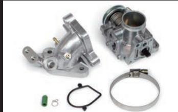
ビッグスロットルボディーキット Φ28