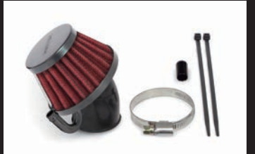
エアフィルターキット(レッド)