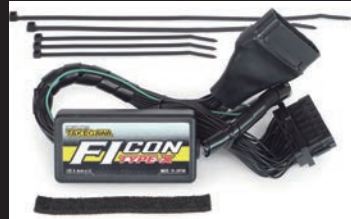
FIコンTYPE-X(インジェクションコントローラー)