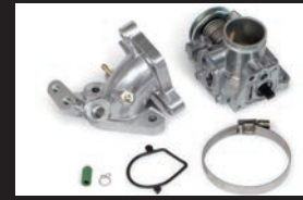
ビッグスロットルボディーキット Φ28