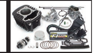
ハイパーSステージキット145cc