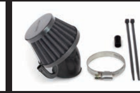
エアフィルターキット(ブラックエレメント)