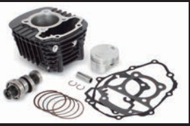
Sステージキット145cc(カムシャフト付属)

※ノーマルエアクリナーへ接続されているコネクティングチューブを外す必要があります。※エアクリナーケースは、エアクリナーガーニッシュを固定する為、取外さず残す必要があります。