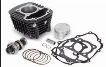
Sステージキット145cc(カムシャフト付属)

吸入効率を高め、ノーマルエンジン、カスタムエンジンのどちらのエンジン仕様であっても出力性能が向上します。純正エアクリナーボックスに繋がるコネクティングチューブを取り外し、スロットルボディーに直接装着します。エアフィルター本体にはフローバイユニオンがついている為、フローバイホースに接続できます。エアフィルターはブラックエレメントとレッドエレメントの2種類。 ■ノーマルエンジン、ノーマルマフラーの車両に本製品を装着する場合、FIコンTYPE-X(インジェクションコントローラー)の同時装着は必要ありません。 ※オフロード走行を行うことは出来ません。 ※カスタムエンジン車(カムシャフト/ボアアップ)、又はSP武川製各種マフラーを本製品と同時装着する場合、FIコンTYPE-X(インジェクションコントローラー)の同時装着が必要になります。 ※ノーマルエアクリナーへ接続されているコネクティングチューブを取り外す必要があります。 ※エアクリナーケースは、エアクリナーガーニッシュを固定する為、取外さず残す必要があります。