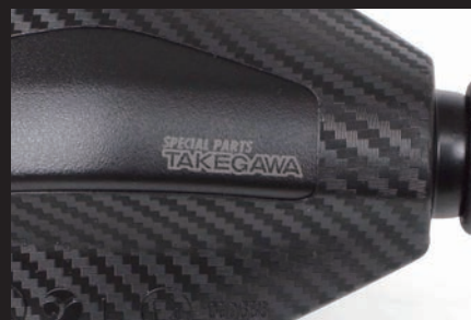
SP武川レーザーマーキングロゴ入り