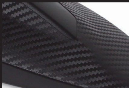
樹脂の立体成形(カーボン繊維形状)