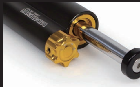
減衰力調整:28段階調整