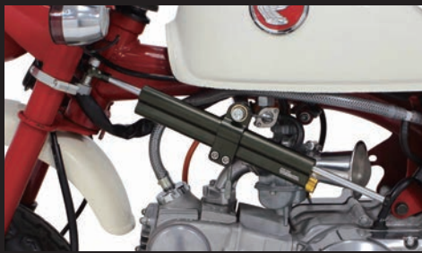
装着イメージ (SP武川製ステアリングダンパーステー同時装着)