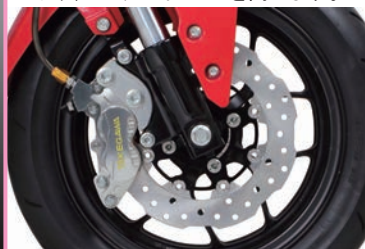
GROM (SP武川製ブレーキホース) SP武川製フロントキャリパーブラケット ディスクローターの同時装着

SP武川製各種キャリパーブラケットを使用し、車両に装着することで、ビレット感が足回りに高級感を与え、カラーアルマイトにより、カスタムイメージを高めます。カラーアルマイトはシルバー、ブラック、ブルーの3種類からお選びいただけます。