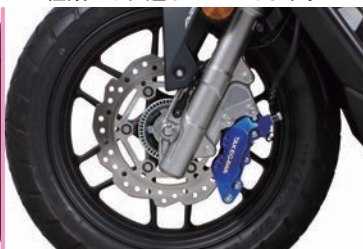
ADV160 (ノーマルブレーキホース) SP武川製フロントキャリパーブラケット ノーマルディスクローターの同時装着