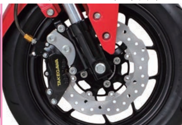
GROM (SP武川製ブレーキホース) SP武川製フロントキャリパーブラケット ディスクローターの同時装着