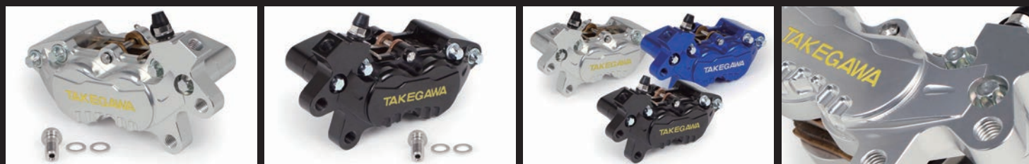
シルバー(06-08-0281)/乗車時“右”用 ブラック(06-08-0285)/乗車時“左”用 カラーは3種類/乗車時“左”用 アルミ削り出しアルマイト仕上げ

■SP武川製キャリパーブラケットキット GROM(JC61/JC75)用(フロント/右用) ADV160用(フロント/左用) モンキー(キャブレター車)SP武川製フロントフォーク装着車/右用等 ※本製品は汎用品になります。取付けピッチ:40mmを含むbrembo社製4POTキャリパーと同様の製品(brembo社製アルミ削り出しタイプ除く)になります。下記寸法図参照。 ※汎用品につき、取付ける車両のディスクローター形状により、ブレーキパッドが接触しない部分が出る場合があります。 その場合、安全の為、ディスクローターとのあたりを確認し、ブレーキパットの不要部分を削り落とす必要があります。