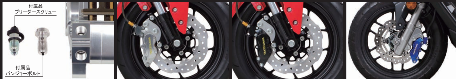
バンジョーボルトの取付け位置を2ヶ所から選択可能 GROM(JC75)(SP武川製ブレーキホース) SP武川製フロントキャリパーブラケット ディスクローターの同時装着 GROM(JC75)(SP武川製ブレーキホース) SP武川製フロントキャリパーブラケット ディスクローターの同時装着 ADV160(ノーマルブレーキホース) SP武川製フロントキャリパーブラケット ノーマルディスクローターの同時装着