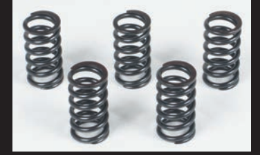
クラッチスプリング27kセット