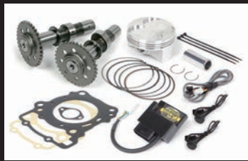
ハイパーチューニングキット