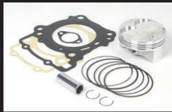
ハイコンピピストン(鍛造ピストン)