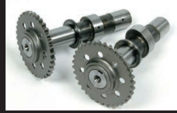
スポーツカムシャフト