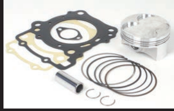
ハイコンピストンキット

※取付けの際には別途R.クランクケースカバーガスケットが必要になります。SP武川製R.クランクケースカバーガスケット 00-02-0187 ¥2,420(税込)