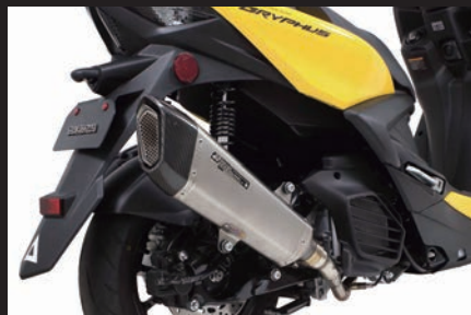
装着写真(シグナス グリファス)