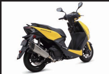
装着写真(シグナス グリファス)