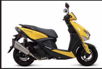
装着写真(シグナス グリファス)