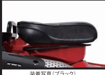
装着写真(ブラック)