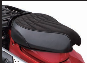
装着写真(スウェード/ブラック)