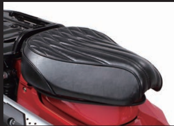
装着写真(ブラック)