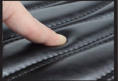
クッション性に優れた特殊スポンジ採用