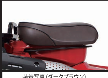
装着写真(ダークブラウン)