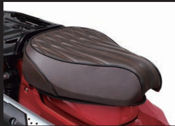
装着写真(ダークブラウン)