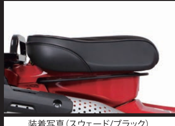
装着写真(スウェード/ブラック)