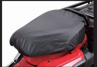
被せて使用できる、雨除けキャップ付属