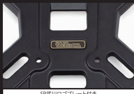
SP武川ロゴプレート付き