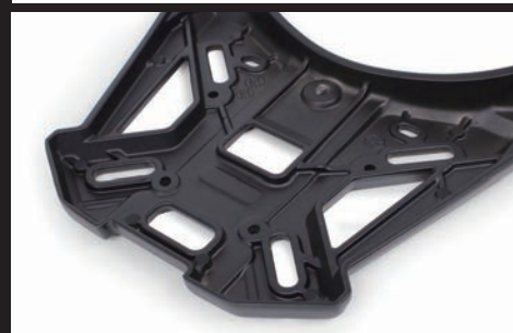
裏面に強度を高めるリップ成型を採用