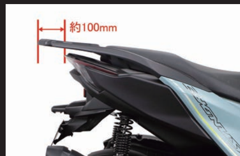
リアキャリア装着時の飛び出し量