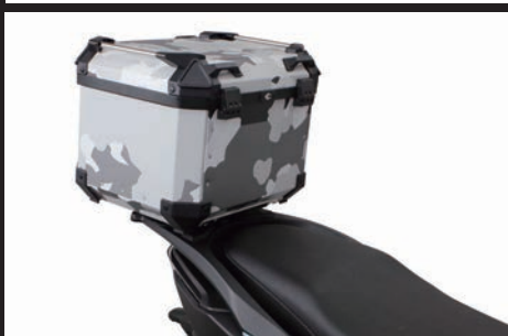
装着写真(ボックス装着時のイメージ)