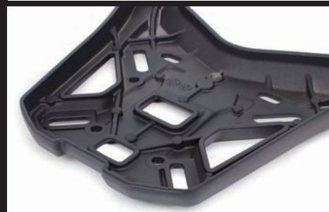
裏面に強度を高めるリップ成型を採用