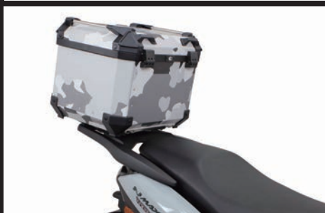
装着写真(ボックス装着時のイメージ)