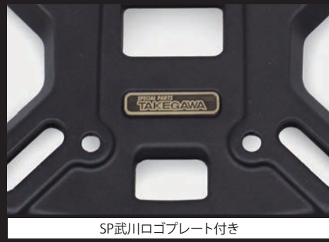
SP武川ロゴプレート付き