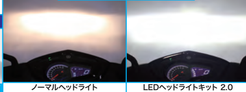
ノーマルヘッドライト LEDヘッドライトキット 2.0