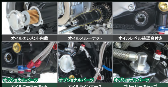
オイルエレメント内蔵 オイルスルーナット オイルレベル確認窓付き