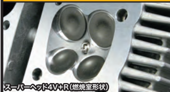
スーパーヘッド4V+R (燃焼室形状)

コンプリートエンジンは弊社メカニックが各パーツを適切な管理の上で組付け作業を行ったハイクオリティーエンジンです。