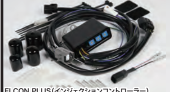
FI CON PLUS (インジェクションコントローラー)

モンキー (FI) 用スーパーヘッド4V+R SCUT148ccコンプリートエンジンに合わせて、専用インジェクションコントローラー“FI CON PLUS”を自社内で開発しました。高性能シリンダーヘッドと大排気量のエンジンスペックを最大限に引出す事が出来ます。 FI CON PLUSは内部に3次元燃料マップを持っており、各種センサーからの信号を元に高速演算を行い、エンジン状況に合わせて最適な燃料噴射を行う事が出来ます。又、燃料噴射回路だけでなく点火系回路も内蔵し、点火タイミングもコンプリートエンジンに合わせて最適化されています。 これらにより、ノーマルECUのレブリミットを超える高回転まで使用することが可能になります。基本マップはカムシャフト、マフラーの違いで設定されています。基本マップからの燃料補正リミッターの回転数設定はFI CON PLUS本体のロータリースイッチをドライバーで回すだけで簡単に設定する事が出来ます。