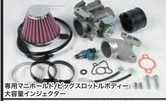
専用マニホールド/ビッグスロットルポディー/大容量インジェクター

TAF5速クロスミッションは高い耐久性と優れた作動性を兼ねており、Sツ어링とスーパーストリートの2種類のギア比が設定されています。コンプリート標準装備はSツ어링5速になります。オーダーシステムにより、スーパーストリート5速クロスミッションを指定出来ます。