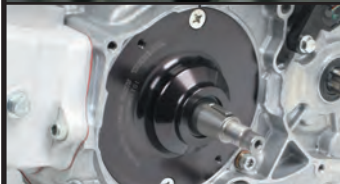
ベアリング内蔵オイルセパレーター

■セラミックメッキシリンダー&ピストン 耐久性、気密性、放熱性に優れたオールアルミ製セラミックメッキシリンダーを採用。 ピストン:ピストンスカート部には初期馴染みを良好にする為、モリブデンコートが施されています。