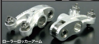
ローラーロッカーアーム

4バルブ化によりバルブカーテン面積を大きくし、吸排気効率を大幅に向上させています。 バルブ径 IN:21.5mm×2 / EX:18.5mm×2 バルブステムシャフト径:IN/EX共に4.0mm オーダーシステムによりチタン合金製バルブスプリングリテーナー及びタペットアダプティングナットの選択が可能 最適なバルブ狭み角とヘッドのコンパクト化に伴い、M8スパークプラグを採用。 ローラーロッカーアーム:フリクションロスを低減させ低速回転から高速回転までスムーズにカムプロファイルを追従します。