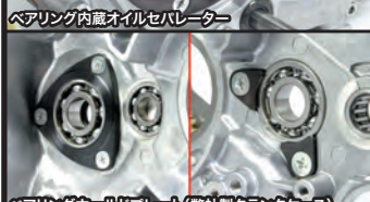
ベアリングホールドプレート (弊社製クランクケース)

オイルセパレーターにベアリングを内蔵することで、クランクシャフト軸を合計3点のベアリングで支持します。フライホイールの重量による揺れや振動を低減し、エンジン性能を引出します。特に大排気量エンジンの高回転域にて高い効果を発揮します。