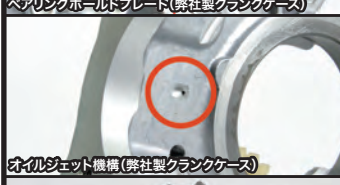
オイルジェット機構 (弊社製クランクケース)

プライマリー式キックスターターは、ギアが何速に入ってもクラッチを切ることでエンジン始動が出来、再スタート時などに素早いエンジン始動が求められるレーシングユースにお薦めです。又、プライマリー式キックの場合、トランスミッションに直接負担をかけずエンジン始動が行えます。