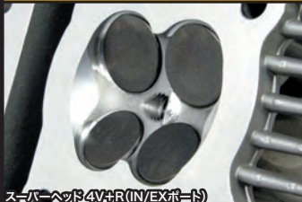
スーパーヘッド4V+R(IN/EXポート)

コンプリートエンジンは弊社メカニックが各パーツを適切な管理の上で組付け作業を行ったハイクオリティエンジンです。