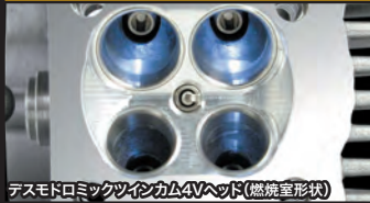
デスモドロミックツインカム4Vヘッド(燃焼室形状)

コンプリートエンジンは弊社メカニックが各パーツを適切な管理の上で組付け作業を行ったハイクオリティーエンジンです。