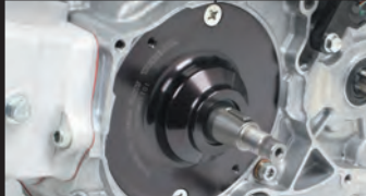
ベアリング内蔵オイルセパレーター