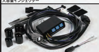
FI CON PLUS(インジェクションコントローラー)