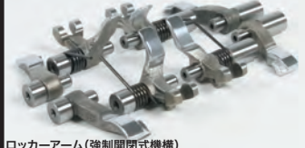
ロッカーアーム(強制閉鎖式機構)

基本マップはカムシャフト、マフラーの違いで設定されています。基本マップからの燃料補正やリミッターの回転数設定はFI CON PLUS本体のロータリースイッチをドライバーで回すだけで簡単に設定する事が出来ます。