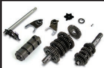
Ape用6速スポーツクロスミッションキット

※本製品を装着した場合、スピードメーターの表示に誤差が生じ、修正するには弊社製ノーマルスピードメーター用スピードセンサーキットの別途購入が必要になります。スピードセンサーキットは使用されるキャリアブレーケットでキットが異なります。WEBカタログをご覧ください。 ※ミッションの交換作業に伴い専用工具が必要になります。