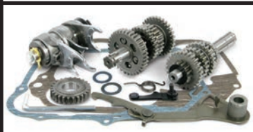
スーパーカブ・リトルカブ(遠心クラッチ車)用

■遠心クラッチからマニュアルクラッチに変更する場合は、マニュアルクラッチキットをご購入の上、モンキー(キャブレター車/マニュアルクラッチ)用のミッションを選択し、取付けて下さい。