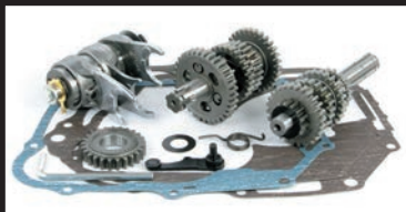
モンキー・ゴリラ(マニュアルクラッチ車)用

■弊社製マニュアルクラッチキットを装着した場合、このミッションキットのギアシフトアーム以外の部品を使用することで、マニュアル5速リターン式になります。 ※弊社マニュアルクラッチキットは、スーパーカブ50(セル付き)/リトルカブ(セル付き)・インジェクション車には取付け出来ません。