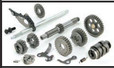
KSR110用4速クロスミッションキット

※乾式クラッチ・ノーマルクラッチでも取付け可能です。 ※乾式クラッチが装着済みで6速ミッションを装着する場合は乾式用のメインシャフトを別途ご購入下さい。 スパークロスミッションは乾式クラッチ用があります。 ※6速スパークロスはレース専用部品の為、一般公道では使用出来ません。 ※ガスケット類はキットには付属しておりません。別途お買い求め下さい。