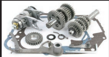
6Vモンキー・DAX(遠心クラッチ車)用