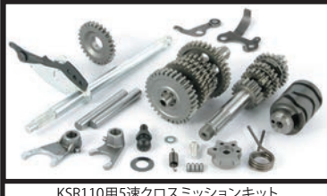
KSR110用5速クロスミッションキット

※ガスケット類はキットには付属しておりません。別途お買い求め下さい。 ※4速クロスミッションもは弊社製ミッションに採用されているドッグ部分のテーパ加工はありません。 ※5速クロス、6速クロスミッションを装着する場合、左クランクケースの加工が必要です。加工につきましては弊社にて行っておりますのでお問い合わせ下さい。(加工代 ¥6,000 税抜/送料別) ※左クランクケースのみお送り下さい。ニュートラルスイッチ、スタッドボルト、ノックピン、オイルフィルター等の付属部品は必ず外して下さい。但し、圧入されているベアリングは外さないで下さい。 ※KSR110/KLX110/04モデル以前の車両に使用される場合はチェンジペダルの取付け径が異なる為、'05モデル以降のチェンジペダルに変更が必要です。 ※KLX110Lは弊社製スペシャルクラッチカバーキット(プライマリドライブギア付属)を同時装着することで取付け可能になります。 ※KSR PROはカワサキ純正部品13151-0055(スイッチ COMP. ニュートラル)と弊社製スペシャルクラッチカバーキット(プライマリドライブギア付属)を同時装着することで取付け可能になります。 ※KSR PROはノーマルクラッチカバーでは取付け出来ません。 ※弊社では138cc/178ccポアアップキットと6速クロスミッションキットの同時装着はお薦めしております。