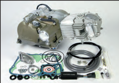
プライマリー式キックスターシステムクランクケース 湿式スペシャルクラッチ 148cc (マグネシウムダイカスト製ブラウン塗装)

標準装備Sツ어링5速 :1速:2.357 2速:1.611 3速:1.190 4速:0.958 5速:0.807 スーパーストリート5速 :1速:2.357 2速:1.764 3速:1.400 4速:1.136 5速:1.000