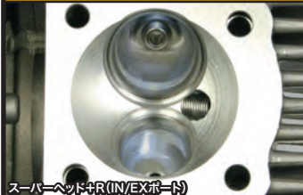
スーパーヘッド+R(IN/EXポート)

コンプリートエンジンは弊社メカニックが各パーツを適切な管理の上で組付け作業を行ったハイクオリティーエンジンです。