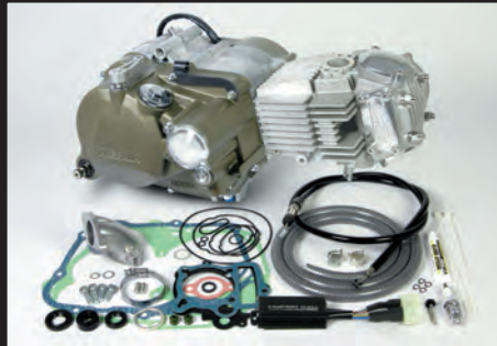
プライマリー式キックスターシステムクランクケース 湿式スペシャルクラッチ 158cc (マグネシウムダイカスト製ブラウン塗装)