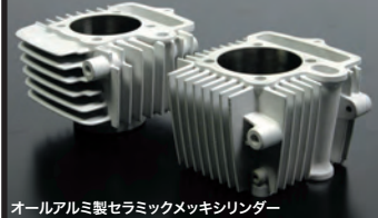
オールアルミ製セラミックメッキシリンダー

弊社オリジナル強化クランクケースは大排気量化することで起きるクランクケースへの負担に対し、ケース剛性を高め、細部にわたり専用設計されたハイクオリティークランクケースです。オイルポンプはクランクシャフトダイレクト駆動式オイルポンプを採用。チェーンドライブ式強化オイルポンプに比べ、吐出量が約2倍になります。ブリーザーパイプは大排気量エンジンのクランクケースの内圧を下げる為、ノーマル内径4mmに対し、内径6mmを採用。クランクケース本体にはオイルジェット機構が装備され、常時コネクティングロッド小端部、ピストン裏側にオイルを直接噴射し、潤滑と冷却を行います。ビッグトルクを受けるミッションベアリングには、専用のベアリングホルルドプレート(弊社製クランクケース)を装備。