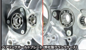
ベアリングホルルドプレート(弊社製クランクケース)

強化クラッチは5ディスクを採用し、ハイパワーエンジンに起こるクラッチの滑りを解消します。湿式スペシャルクラッチが標準設定でカバーはマグネシウムダイカスト製を採用。マグネシウム製クラッチカバー表面にはブラウン塗装が施されています。湿式クラッチクラッチカバーはサーモスタットの取付けを可能とした特許取得クラッチカバーです。別売のサーモスタットユニットを装着することで、オーバークールを防止することが出来ます。更にオイル取出し口が装備され、オイルクーラーへのオイル取出しが行えます。標準装備が湿式スペシャルクラッチ(スリッパークラッチ機構有り)です。オーダーシステムにより、スリッパークラッチ機構有りからスリッパークラッチ機構無しへ変更出来ます。スリッパークラッチ機構は高回転時のシフトダウンによる急激なエンジンブレーキのショックを緩和します。