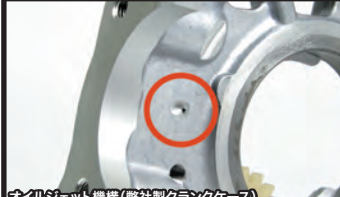
オイルジェット機構(弊社製クランクケース)

ストリートからレーシングユースまで安定した高出力を可能としながら、ストリート走行に必要となるノーマル同様の灯火類の明るさと走行中に消費する電力を補う充電レベルを可能としました。弊社製ローター本体は、ノーマル比約50%軽量化されたミディアムサイズのフライホイールを採用し、クランクシャフトへの負担を減少しながら、「乗り易さと必要な発電力」を実現しています。更にビッグアップのポジションを見直し、多様なポアアップキットに対応する最適な点火タイミングを設定し、ノーマルローターでは得ることの出来ない高い出力特性とレスポンスを可能にしています。