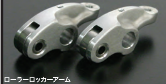
ローラーロッカーアーム

■セラミックメッキシリンダー(SCUT148cc/SCUT158ccは特許取得SCUT構造を採用)&ピストン 耐久性、気密性、放熱性に優れたオールアルミ製セラミックメッキシリンダーを採用。シリンダーには温度センサー取付け部を標準装備。弊社製サーモメーター内蔵メーター、又はサーモメーターをご購入頂くことでシリンダー温度を計測することが出来ます。 148cc/158cc(プライマリー式)用スカットシリンダー：M5温度センサー ピストン：ピストンスカート部には初期馴染みを良好にする為、モリブデンコートが施されています。