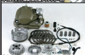
湿式スペシャルクラッチ(プライマリー式)