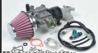
専用マニホールド/ビッグスロットルポディー大容量インジェクター

強化クラッチは5ディスクを採用し、ハイパワーエンジンに起因するクラッチの滑りを解消します。湿式スペシャルクラッチ(プライマリー式)のクラッチカバーはマグネシウムダイカスト製を採用。表面にはブラウン塗装が施されています。クラッチカバーはサーモスタットの取付けを可能とした特許取得クラッチカバーです。別売のサーモスタットユニットを装着することで、オーバーヒートを防止することが出来ます。更にオイル取出し口が装備され、オイルクーラーへのオイル取出しが行えます。湿式スペシャルクラッチ(プライマリー式)は標準装備がスリッパークラッチ機構有りになります。スリッパークラッチ機構は高回転時のシフトダウンによる急激なエンジンブレーキ時にクラッチがスリッパる事により、必要以上のバックトルクを緩和します。