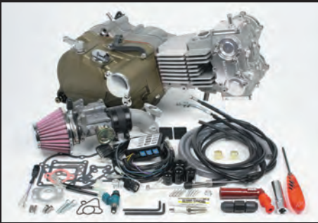
プライマリー式キックスターシステムクランクケース 湿式スペシャルクラッチ (マグネシウムダイカスト製ブラウン塗装)

標準装備TAF5速クロスミッション(Sツ어링)からTAF5速クロスミッション(スーパーストリート)へ変更します。※変更時、標準クロスミッションは付属しません。 標準装備Sツ어링5速 :1速:2.357 2速:1.611 3速:1.190 4速:0.958 5速:0.807 スーパーストリート5速 :1速:2.357 2速:1.764 3速:1.400 4速:1.136 5速:1.000