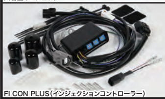
FI CON PLUS(インジェクションコントローラー)

大幅な排気量アップと高性能シリンダーヘッドの採用により純正を遥かに上回る吸入空気量に対応するため、ビッグスロットルポディー及び専用マニホールドと大容量インジェクターを装備。弊社製マフラーと組み合わせることでエンジンの性能を遺憾無く発揮することが出来ます。