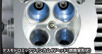
デスモドロミックツインカム4Vヘッド(燃焼室形状)

コンプリートエンジンは弊社メカニックが各パーツを適切な管理の上で組付け作業を行ったハイクオリティーエンジンです。