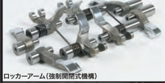
ロッカーアーム(強制開閉式機構)

デスモドロミック機構は、特殊形状カムシャフトとロッカーアームによりバルブを強制的に閉鎖する機構で、バルブスプリングが無いことから高回転域でのサージングが起らず、カムシャフト駆動に関わるフリクションが非常に少ないのが特徴です。デスモドロミック機構の特性に弊社のシリンダーヘッド開発技術が加わり、最高峰クラスの吸排気効率と高いエンジン性能を実現しました。バルブ径 インテーク:22mm×2 / エキゾースト:19mm×2