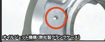
オイルジェット機構(弊社製クランクケース)

弊社オリジナル強化クランクケースは大排気量化することで起るクランクケースへの負担に対し、ケース剛性を高め、細部にわたり専用設計されたハイクオリティークランクケースです。オイルポンプはクランクシャフトダイレクト駆動式オイルポンプを採用。チェーンドライブ式強化オイルポンプに比べ、吐出量が約2倍になります。プリーザーパイプは大排気量エンジンのクランクケースの内圧を下げる為に内径6mmを採用。クランクケース本体にはオイルジェット機構を装備し、常時コネクティングロッド小端部、ピストンにオイルを直接噴射し、潤滑と冷却を行います。ビッグトルクを受けるミッションベアリングには、専用のベアリングホルドプレートを装備。