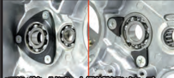
ベアリングホルドプレート(弊社製クランクケース)

クランクシャフトの耐久性を高める補強パーツです。クランクケースに取付けるサポートプレート内にボールベアリングを設けることで、クランクシャフトジャーナル部を2点支持から3点支持に変更し、エンジンの高回転域に起因するクランクシャフトの振れを制限することが出来ます。 特に大排気量エンジンの高回転域にて高い効果を発揮します。