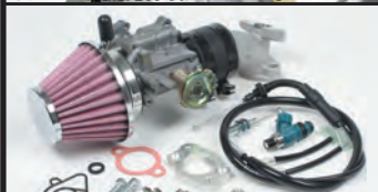
専用マニホールド/ビッグスロットルポディー大容量インジェクター

強化クラッチは5ディスクを採用し、ハイパワーエンジンに起こるクラッチの滑りを解消します。 湿式スペシャルクラッチ(プライマリー式)のクラッチカバーはマグネシウムダイカスト製を採用。表面にはブラウン塗装が施されています。 クラッチカバーはサーモスタットの取付けを可能とした特許取得クラッチカバーです。別売のサーモスタットユニットを装着することで、オーバーヒートを防止することが出来ます。 更にオイル取出し口が装備され、オイルクーラーへのオイル取出しが行えます。 湿式スペシャルクラッチ(プライマリー式)は標準装備がスリッパークラッチ機構有りになります。 オーダーシステムにより、スリッパークラッチ機構無しへの変更も可能です。 スリッパークラッチ機構は高回転時のシフトダウンによる急激なエンジンブレーキ時にクラッチがスリップする事により、必要以上のバックトルクを緩和します。