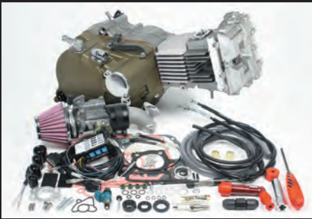
プライマリー式キックスターシステムクランクケース 湿式スペシャルクラッチ (マグネシウムダイカスト製ブラウン塗装)

標準装備TAF5速クロスミッション(Sツ어링)からTAF5速クロスミッション(スーパーストリート)へ変更します。※変更時、標準クロスミッションは付属しません。 標準装備Sツ어링5速 : 1速:2.357 2速:1.611 3速:1.190 4速:0.958 5速:0.807 スーパーストリート5速 : 1速:2.357 2速:1.764 3速:1.400 4速:1.136 5速:1.000