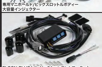
FI CON PLUS(インジェクションコントローラー)

大幅な排気量アップと高性能シリンダーヘッドの採用により純正を遥かに上回る吸入空気量に対応するため、ビッグスロットルポディー及び専用マニホールドと大容量インジェクターを装備。弊社製マフラーと組み合わせることでエンジンの性能を遺憾無く発揮することが出来ます。