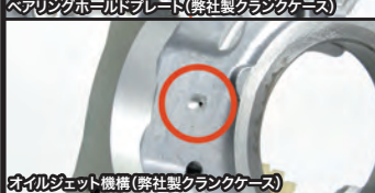
オイルジェット機構(弊社製クランクケース)

弊社オリジナル強化クランクケースは大排気量化することで起きるクランクケースへの負担に対し、ケース剛性を高め、細部にわたり専用設計されたハイクオリティークランクケースです。オイルポンプはクランクシャフトダイレクト駆動式オイルポンプを採用。チェーンドライブ式強化オイルポンプに比べ、吐出量が約2倍になります。 プリーザーパイプは大排気量エンジンのクランクケースの内圧を下げる為に内径6mmを採用。 クランクケース本体にはオイルジェット機構を装備し、常時コネクティングロッド小端部、ピストンにオイルを直接噴射し、潤滑と冷却を行います。 ビッグトルクを受けるミッションベアリングには、専用のベアリングホルドプレートを装備。