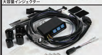
FI CON PLUS(インジェクションコントローラー)

モンキー(FI)用スーパーヘッド4V+R SCUT148ccコンプリートエンジンに合わせて、専用インジェクションコントローラー“FI CON PLUS”を自社内で開発しました。高性能シリンダーヘッドと大排気量のエンジンスペックを最大限に引出す事が出来ます。 FI CON PLUSは内部に3次元燃料マップを持っており、各種センサーからの信号を元に高速演算を行い、エンジン状況に合わせて最適な燃料噴射を行う事が出来ます。又、燃料噴射回路だけでなく点火系回路も内蔵し、点火タイミングもコンプリートエンジンに合わせて最適化されています。 これらにより、ノーマルECUのレブリミットを超える高回転まで使用することが可能になります。基本マップはカムシャフト、マフラーの違いで設定されています。基本マップからの燃料補正やリミッターの回転数設定はFI CON PLUS本体のロータリースイッチをドライバーで回すだけで簡単に設定する事が出来ます。