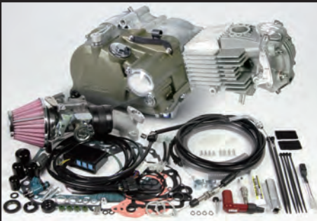
プライマリー式キックスターシステムクランクケース 湿式スペシャルクラッチ (マグネシウムダイカスト製ブラウン塗装)

標準装備Sツ어링5速 :1速:2.357 2速:1.611 3速:1.190 4速:0.958 5速:0.807 スーパーストリート5速 :1速:2.357 2速:1.764 3速:1.400 4速:1.136 5速:1.000