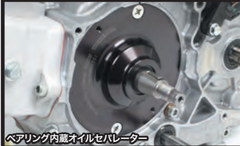
ベアリング内蔵オイルセパレーター

■セラミックメッキシリンダー&ピストン 耐久性、気密性、放熱性に優れたオールアルミ製セラミックメッキシリンダーを採用。 ピストン:ピストンスカート部には初期馴染みを良好にする為、モリブデンコートが施されています。