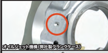
オイルジェット機構(弊社製クランクケース)

プライマリー式キックスターターは、ギアが何速に入ってもクラッチを切ることでエンジン始動が出来、再スタート時などに素早いエンジン始動が求められるレーシングユースにお薦めです。又、プライマリー式キックスターターの場合、トランスミッションに直接負担をかけずエンジン始動が行えます。