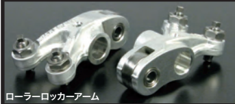
ローラーロッカーアーム

4バルブ化によりバルブカーテン面積を大きくし、吸排気効率を大幅に向上させています。 バルブ径 IN:21.5mm×2 / EX:18.5mm×2 バルブステムシャフト径:IN/EX共に4.0mm オーダーシステムによりチタン合金製バルブスプリングリテーナー及びタペットアダプタスティングナットの選択が可能 最適なバルブ狭み角とヘッドのコンパクト化に伴い、M8スパークプラグを採用。 ローラーロッカーアーム:フリクションロスを低減させ低速回転から高速回転までスムーズにカムプロファイルを追従します。