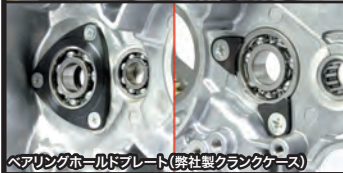
ベアリングホルドプレート(弊社製クランクケース)

オイルセパレーターにベアリングを内蔵することで、クランクシャフト軸を合計3点のベアリングで支持します。フライホイールの重量による揺れや振動を低減し、エンジン性能を引出します。特に大排気量エンジンの高回転域にて高い効果を発揮します。