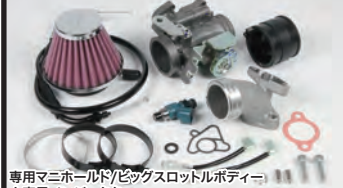
専用マニホールド/ビッグスロットルボディ/大容量インジェクター

大幅な排気量アップと高性能シリンダーヘッドの採用により純正を遥かに上回る吸入空気量に対応するため、ビッグスロットルボディ及び専用マニホールドと大容量インジェクターを装備。弊社製マフラーと組み合わせることでコンプリートエンジンの性能を遺憾無く発揮することが出来ます。