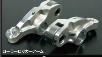
ローラーロッカーアーム

弊社製モンキー系エンジン用スーパーヘッド+Rで定評のローラーロッカーアームを縦型エンジンに採用し、スーパーヘッドの出力性能を最大限に引出しながら、中高速域の出力アップとローラーロッカーアームの特徴でもある高回転域での出力維持を可能としました。ローラーロッカーアームはスリッパ式ロッカーアーム(純正部品タイプ)に起こるカムシャフトとの摩擦抵抗を低減させ、ロッカーアーム内蔵のローラーベアリングにより、低回転から高回転までスムーズにカムプロファイルを追従します。ロッカーアーム本体をアルミ鍛造製にすることで、ローラーベアリングによる重量増加を克服しました。