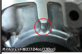
オイルジェット加工(124cc/130cc)