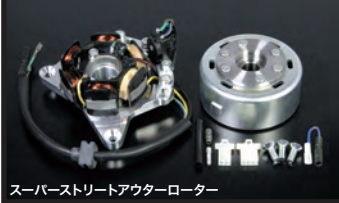
スーパーストリートアウターローター