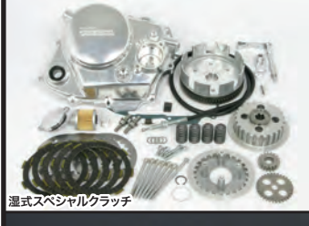
湿式スペシャルクラッチ