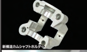
新構造カムシャフトホルダー