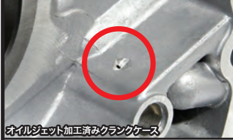
オイルジェット加工済みクランクケース