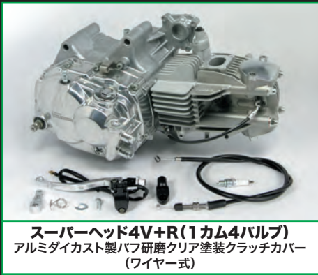
スーパーヘッド4V+R(1カム4バルブ) アルミダイカスト製バフ研磨クリア塗装クラッチカバー (ワイヤー式)