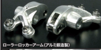
ローラーロッカーアーム(アルミ鍛造製)

ノーマルクラッチ(5ディスク)に対し、6ディスクにすることでクラッチ容量アップが可能。ノーマルスプリングとの組み合わせによりスプリングセット加重を低く設定することが出来、クラッチ操作を軽くすることが出来ます。他に1次減速比14%アップタイプのプライマリドライブギア、ノーマルより10%アップの強化クラッチスプリングが組込まれる為、スロットルレスポンスが向上し、クランクシャフトの回転を100%2次側クラッチに伝達することが出来ます。 ※燃料は必ずハイオクタン価がソリンを使用してください。(ノッキング等のトラブルで事故につながる恐れがあります) ※エンジンオイルは入っていません。※点火系、キックスターターアーム、ジェネレーターカバー、ジェネレーターカバーが付属していません。 ※シリンダーヘッド変更、排気量アップに伴い、弊社製ビッグボアキャブレターキット、マフラーの別途購入が必要になります。