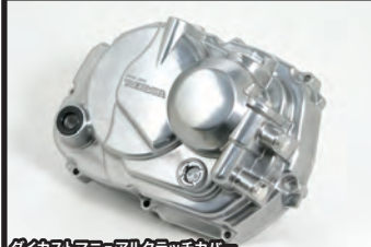
ダイカストマニュアルクラッチカバー