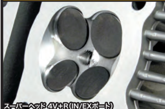
スーパーヘッド4V+R(IN/EXポート)

コンプリートエンジンは弊社メカニックが各パーツを適切な管理の上で組付け作業を行ったハイクオリティエンジンです。