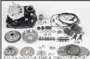
スペシャルクラッチ TYPE-R (DRY/ワイヤー式)

■スペシャルクラッチキット TYPE-R (WET / DRY) 湿式(WET)と乾式(DRY)の2種類からお選び頂けます。 機能性に優れたスペシャルクラッチカバーにハイエンドクラッチユニットを採用したスペシャルクラッチキットを装備。