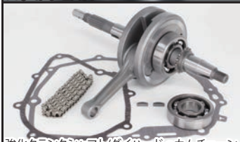
強化クランクシャフト/ダイハードαカムチェーン

■強化クランクシャフト(X断面形状コンロッド採用) X断面形状コネクティングロッドを採用することで、高強度と共に軽量化を実現します。これにより、ノーマルクランクシャフトに比べ、大幅な強化仕様となり、高排気量のコンプリートエンジンに対応します。軽量化と共に充分な強度を確保し、座屈応力の拡散とネジれ剛性が大幅に向上します。表面はショット仕上げ ダイハードαカムチェーン88L採用