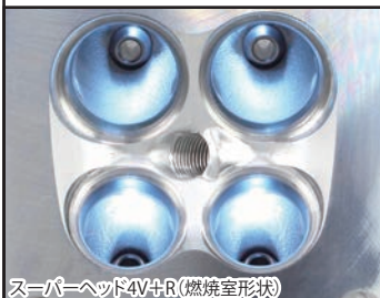
スーパーヘッド4V+R(燃焼室形状)

コンプリートエンジンは各パーツを適切な管理の上で組み立てたハイクオリティエンジンです。