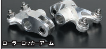
ローラーロッカーアーム

インスペクションブリーザーカバーが付属している為、別途オイルキャッチタンクキットをご購入頂くことで、エンジンの内圧力を逃がすことが出来ます。インスペクションブリーザーカバー、インスペクションカバー、Lシリンダーヘッドサイドカバーはすべてアルミダイカスト製バレル研磨仕上げ