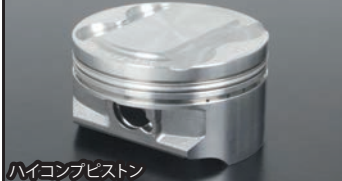
ハイコンピストン

■シリンダー&ピストン シリンダー:シリンダーは耐久性、気密性、放熱性に優れたオールアルミ製セラミックメッキシリンダーを採用。 表面処理 GROM用:ブラック塗装仕上げ モンキー125用:無塗装のシルバー オイル取出口が装備され、オイルクーラーへのオイル取出口が行えます。コンプリートエンジンの場合、このオイル取出口を使用し、オイルラインホースにてスペシャルクラッチカバーとシリンダーを接続しております。これにより、シリンダーヘッド側に流れるオイルラインをオイルエレメント経由に変更しています。 ハイコンピストン(圧縮比12.5:1を採用) 高性能と耐久性を追求したピストン。ピストントップはNC加工により、高精度に仕上げています。