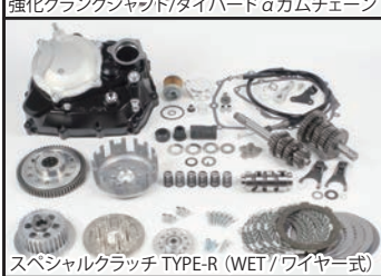
スペシャルクラッチ TYPE-R (WET/ワイヤー式)

■ビッグスロットルボディキット スーパーヘッドの性能を最大限に引出し、高回転域までストレス無く回るエンジン特性をお楽しみ頂けます。ボア径:Φ34 エアフィルターキット(ビッグスロットルボディ用):表面積の増大により、高い吸入効率を得ることが出来ます。ブローバイユニオン付きビッグスロットルボディ装着に伴い、コンプリートエンジンに付属の大容量インジェクタへ変更します。 又、GROMには、更にシュラウドステーが付属。シュラウドステーには、SP武川製オイルクーラー本体の装着が可能。 ※シュラウドステーに装着出来るSP武川製オイルクーラーキット に関してはWEB SITEをご覧ください。