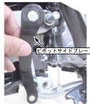
ピボットサイドプレート

注意 ：必ず規定トルクを守る事。 フランジボルト トルク：27N・m (2.8kgf・m)