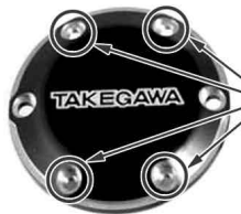
ソケットキャップスクリュー 5×5 +ワッシャ