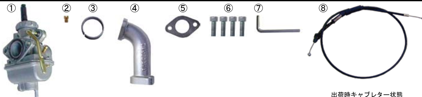
出荷時キャブレター状態