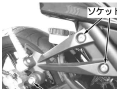
マフラーマウントボルト

R.ステップホルダーよりマフラーブッシングラバーを取り外し、逆手順にて本キットのマフラスターに取り付けます。マフラスターをソケットキャップスクリュー8×3.5 2本で取り付けます。