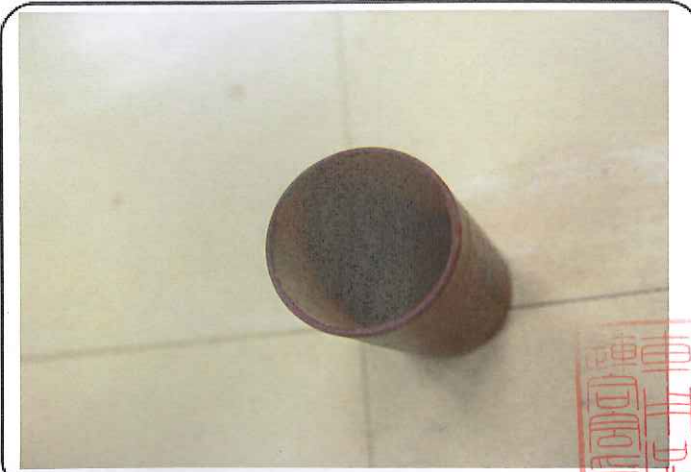
目視による排ガス対策装置の確認方法