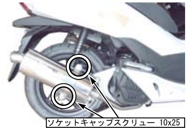
ソケットキャップスクリュー 10x25

○オーバルサイレンサー COMP. にサイレンサーバンドを挟み込む様に取り付け、付属のソケットキャップスクリュー 10x25、ワッシャ 10mm を上下に取り付け、サイレンサーバンドを仮締めします。