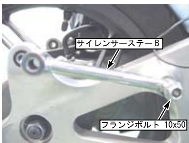
サイレンサーステー B フランジボルト 10x50