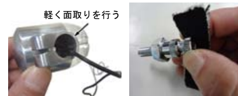
軽く面取りを行う

☆ウインカーステーが大きく、スムーズにウインカーが入らない場合は、ウインカーの穴にステーを押し当て、斜めに力が逃げない様にゆっくりと力を入れ挿入します。それでも挿入が困難な場合、ウインカーのステー挿入穴エッジ部を軽く面取りを行うか、ウインカーステーの先端をペーパー等を当て、先端の径を若干小さくし、挿入しやすくなる様、加工を行います。