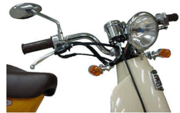
ミラーはオプション(別売)です。

(スピードメーターを交換するとニュートラルランプ、ターンランプが無くなりますので、各メーターサイズに合ったインジケーターランプホルダーキットを使用して下さい)