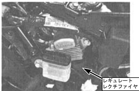
(写真は GROM の場合)