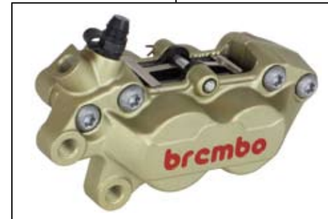
00-06-0160 brembo 4P キャリパー左用 (パッド調整済) (キャスト/ゴールド/40mm ピッチ)