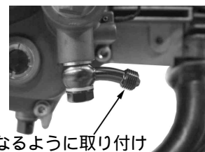
下向きになるように取り付け