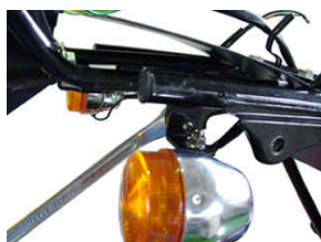
ノーマルウィンカー