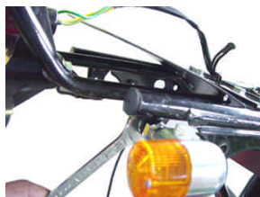
ウィンカーキット