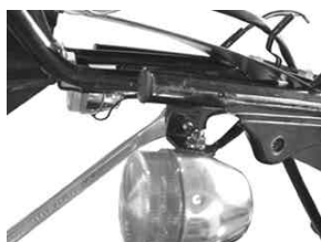
ノーマルウィンカー