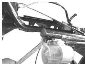
ウィンカーキット